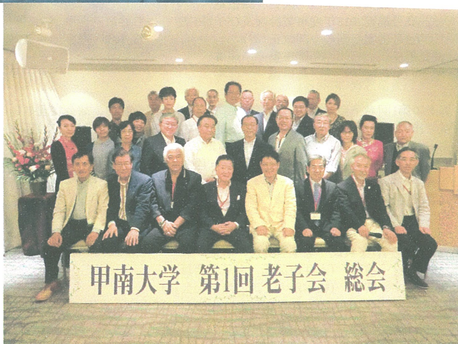
総会出席会員の集合写真